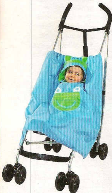
23 Poncho poussette Peut être utilisé comme un poncho classique. Fnac Eveil & Jeux, 12,50€.