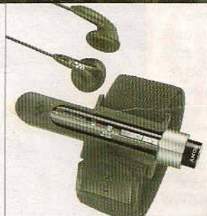
25 «I'm singing in the rain» Walkman audionumérique étanche. 18 heures de musique. Sony, 140€.