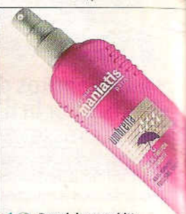
18 Parapluie en pschitt Spray cheveux anti-humidité et anti-umbrella. Club des Créateurs de Beauté.