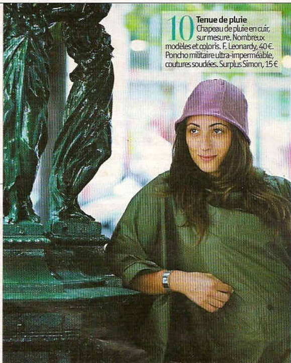
10 Tenue de pluie Chapeau de pluie en cuir, sur mesure. Nombreux modèles et coloris. F. Leonardy, 40€. Poncho militaire ultra-imperméable, coutures soudées. Surplus Simon, 15€.