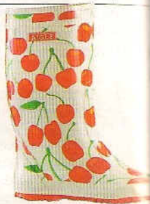
11 Tutti frutti Bottes enfants en caoutchouc. Exotique motif fraises, pommes ou cerises.