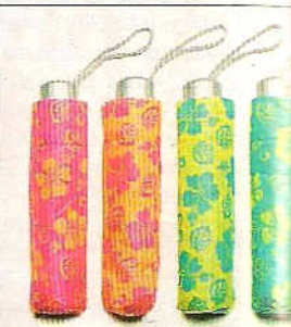
26 Format poche Miniparapluies, déclinés en couleurs acidulées. Casa, 3€.