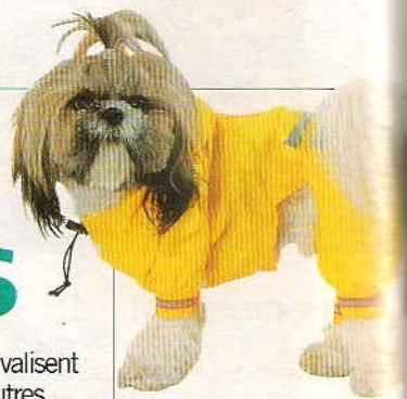
1 Temps de chien Imperméable pour toutou avec capuche en 3 tailles. La Chaise Longue, à partir de...