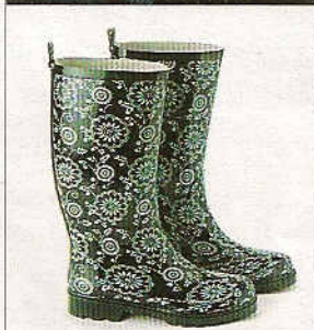
24 Il pleut! Bottes en caoutchouc. Du 36 au 41. Casa, 15€.